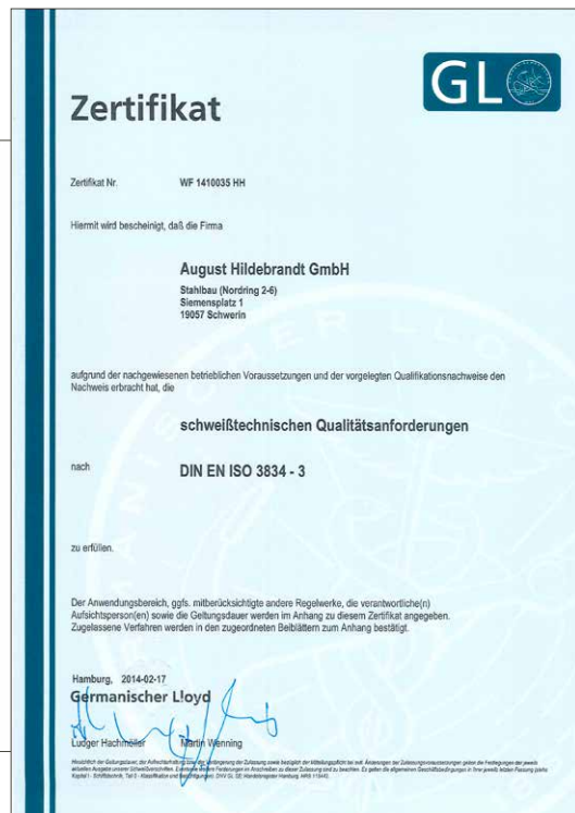
Abbildungen: Zertifikate durch den DNV GL